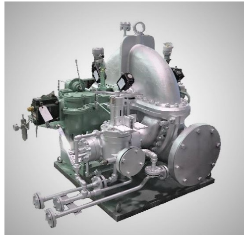
《参考画像》今回納入予定機器と同型式のポンプ及び駆動用蒸気タービン